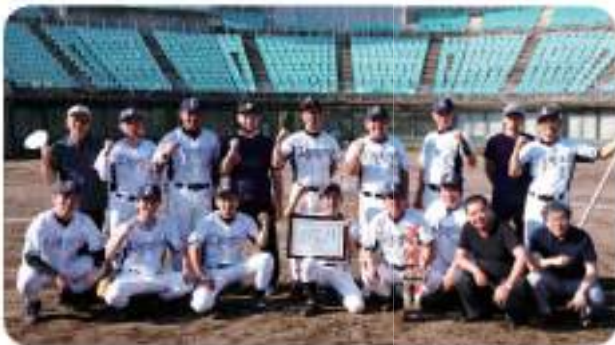
九州県議会議員野球大会で準優勝(福岡県)