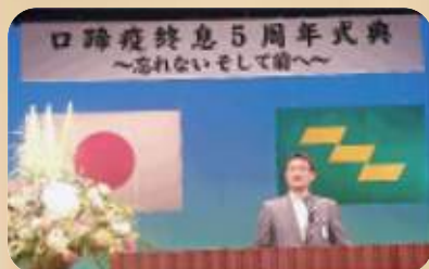
式典での知事のごあいさつ

牛7万頭、豚22万頭を犠牲にし、本県経済に大打撃を与えた口蹄疫が終息して5年を迎えた8月27日、川南町で終息5周年式典が開催されました。多くの関係者の出席のもと、「みやざき畜産新生」の取組宣言が行われました。「忘れないそして前へ」という強い信念のもとで、2度と発生させることが無いよう家畜防疫対策をしっかりと講じなければなりません。そして、繋がった高速道路を活用して農畜産業をはじめ、本県産業の着実な再生と新たな成長に取り組んでいかなければなりません。