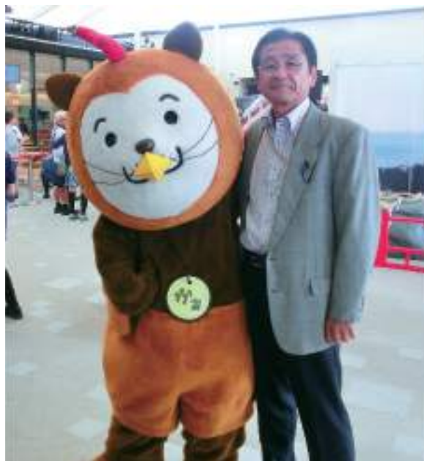
本県のマスコット「みやざき犬」と

さて、一番の長丁場となる9月定例県議会が終了いたしました。今回私の質問はありませんでしたが、今議会のトピックス等をご紹介します。