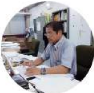
県議会会派控室で執務中