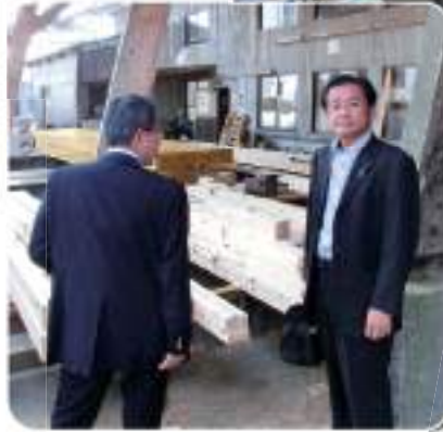
林業活性化議員連盟の CLT工法視察(鹿児島県肝付町)