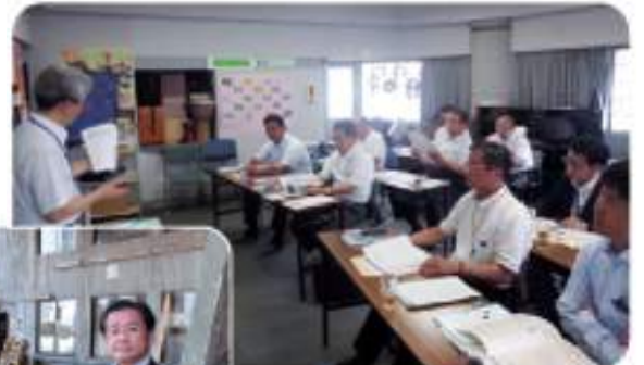
文教警察企業常任委員会 県外調査(東京シュレー)