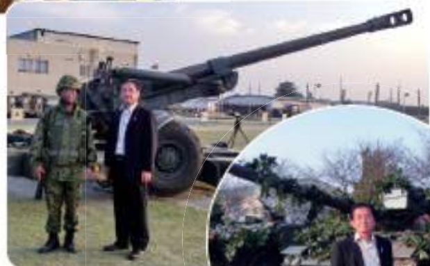
九州防衛議員連盟連絡 協議会総会時の視察 (陸上自衛隊都城駐屯地)