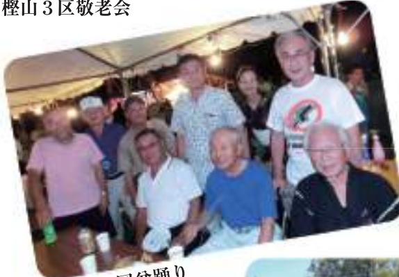
桜ヶ丘合同盆踊り