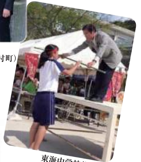
東海中学校体育大会