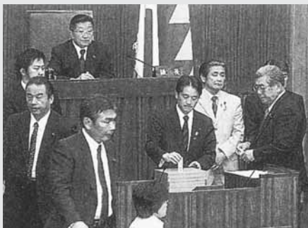
議場での採決 (毎日新聞 09.3.4)

定数6減の39はすでに全会一意で合意。選挙区は、自民等以外の4会派が修正案を、また議論が尽くされていないと自民党から3人の離脱等もありましたが、数で勝る自民党の賛成多数で可決。県北は日向1減、東臼杵1減と2議席減少しますが、県北の発言力が低下しないよう、更に結束を固めていかなければなりません。