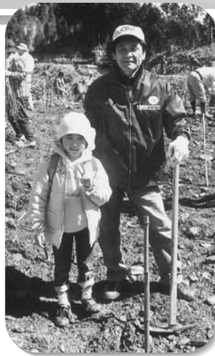
今年も植林に行ってきました (参加者のお子さんと・日之影町 09.3.15)