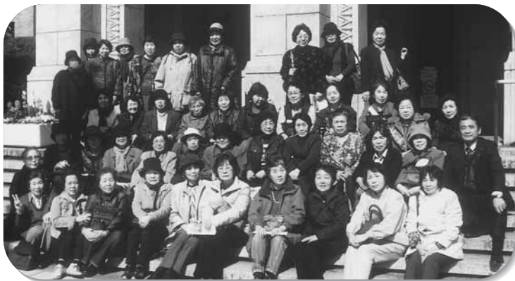
延岡地区年金受給者協会女性部の皆さんが県庁見学に(09.2.17)