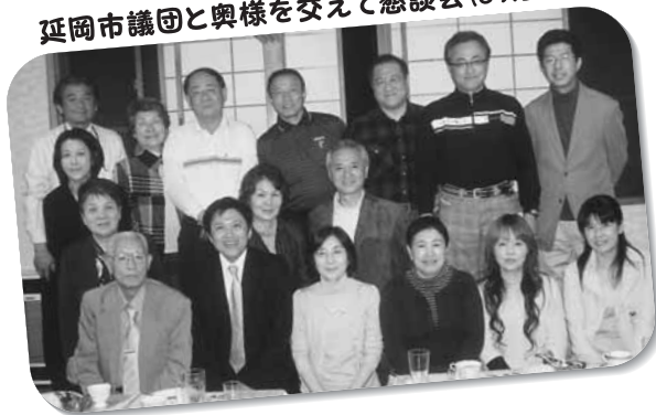
延岡市議団と奥様を交えて懇談会(09.3.22)