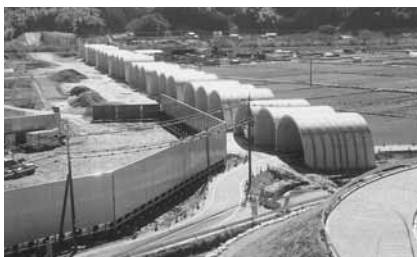
建設が進む東九州自動車道の一部となる国道10号延岡道路(祝子町)

東九州自動車道は片側2車線の上下4車線で計画されています。しかし、暫定2車線で建設中です。建設中の「門川～西都間」は、